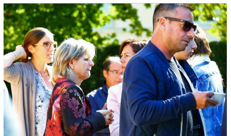
Le temps du café dans le parc du château avant la visite du potager et du verger XIX e ...