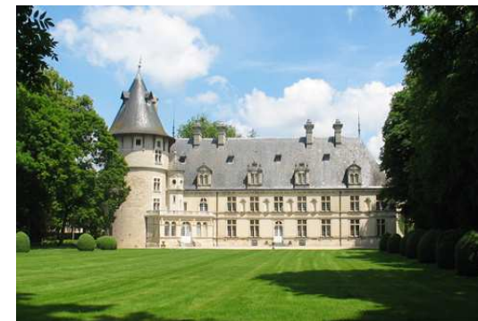
Monument historique privé Huit siècles d'histoire et d'architecture

Membre de la Demeure Historique, des Vieilles Maisons Françaises et de The French Heritage Society